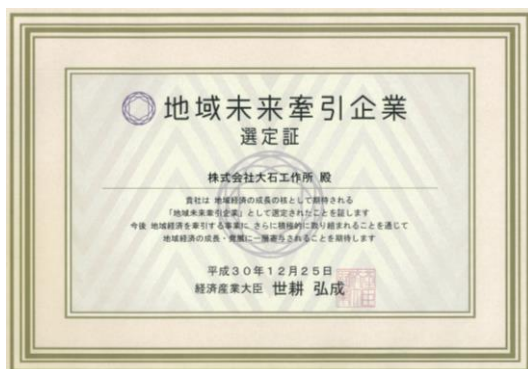
地域未来牽引企業 選定

【主な取組み】 規律保持管理方針の明示とコンプライアンスの徹底 不正競争・汚職・贈収賄禁止明示・徹底 人権尊重・労働安全衛生徹底にかかる協力会社への啓蒙