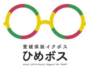
愛媛県版イクボス ひめボス Work, Life & Social Support for Staff