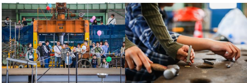
「えひめさんさん物語」への参画

【主な取組み】 地元人材の積極採用 東予エリア地域振興イベント「えひめさんさん物語」への参画 (オープンファクトリー・ものづくりワークショップの開催)