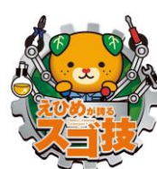
愛媛ものづくり企業「ソゴ技」認定