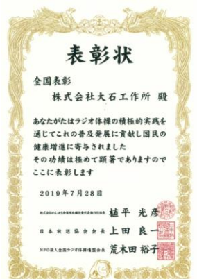
ラジオ体操優良団体表彰(全国表彰)